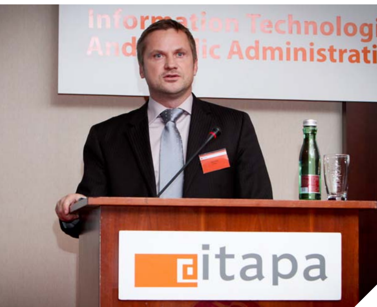
DATALAN DIGITÁLNE MESTO® na princípe cloudového riešenia bolo predstavené aj na medzinárodnom kongrese ITAPA 2011.

Môže sa zdať, že brzdou pre mestá, či obce je obmedzený rozpočet, ide však o krátkodobý pohľad. Áno, rozhodovanie o výdavkoch je vždy ťažké, v prípade nášho riešenia však mesto, či obec získava nielen záruku návratnosti investície a efektívneho využitia finančných prostriedkov, ale aj okamžité zjednodušenie fungovania úradu. Za väčšiu prekážku preto považujem legislatívne obmedzenia. Jeden fakt za všetky: v susedných Čechách došlo po prijatí legislatívnych úprav k vytvoreniu legálnej elektronickej dátovej schránky a ku skokovému nárastu elektronickej komunikácie centrálnaj verejnej správy ako aj samospráv a obyvateľov. Verím, že podobná situácia nastane čoskoro aj u nás.